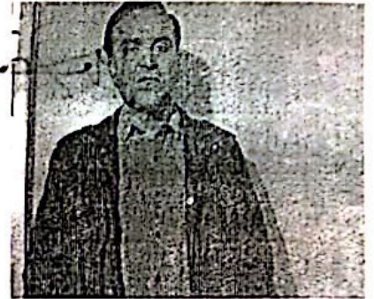
उप / सयुक्त पंजीयन अधिकारी